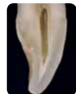
Prof. Marleen Peumans (Belgium)

A hagyományos színrendszerek különböző színárnyalatokra épülnek, amik A, B, C és D néven ismertek. Ugyanakkor tudjuk, hogy a zománcnak és a dentinnek más a karakterisztikája , és mindkettő hozzájárul a fog végső színének érzékeléséhez. Azáltal, ha elszakadunk a hagyományos monokromatikus színektől, és az enamel és a dentin karakterisztikájának reprodukálására fókuszálunk , mindössze két egyszerű réteggel juthatunk egy sokkal természetesebb eredményhez.